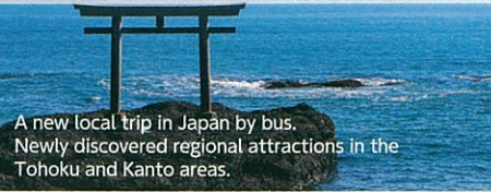
A new local trip in Japan by bus. Newly discovered regional attractions in the Tohoku and Kanto areas.