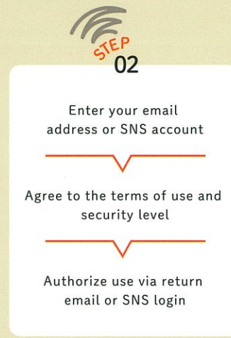
After entering email address or SNS account, please complete registration.