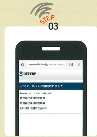
After following the instructions displayed to authorize login, you will be connected to the internet.

If the login screen does not appear When you could not access the login page despite connecting the SSID, please input "jwifi.jp" in the address bar or scan the QR code.