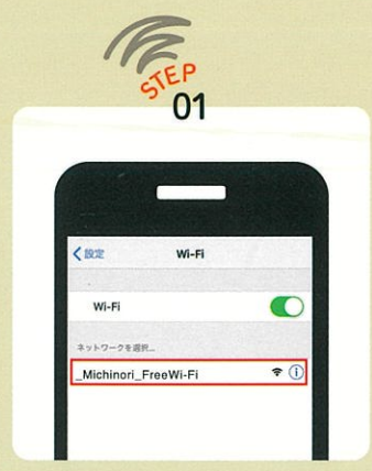
端末の設定画面で「_Michinori_FreeWi-Fi」を選択し、インターネットブラウザを起動。