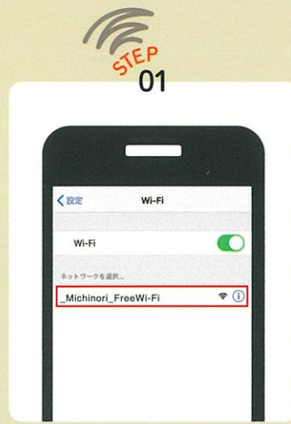
Connect to 「_Michinori_FreeWi-Fi」 and Open the browser.