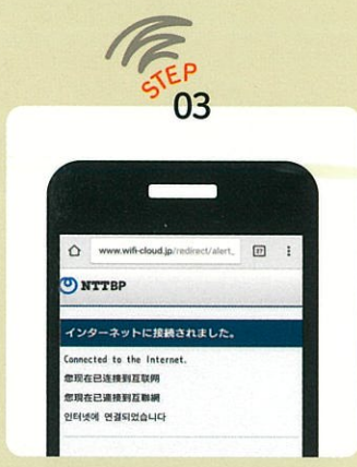
画面の案内に沿って、認証手続きを進め、接続完了。(上記画面ができれば接続成功)

接続画面が表示されない方はこちら ログイン画面が表示されない場合、ブラウザに「jwifi.jp」を入力するか、右のQRコードを読み取ってください。 ※QRコードは(株)デンソーウェブの登録商標です。