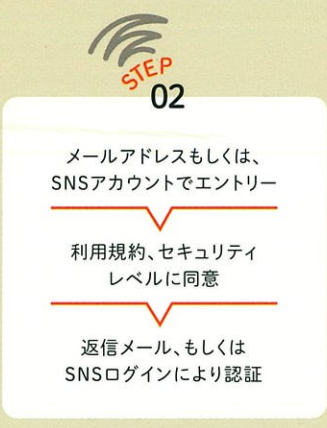
メールアドレスもしくは、SNSアカウントでエントリー、利用規約、セキュリティレベルに同意、返信メール、もしくはSNSログインにより認証