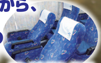
ドリームふくしま・横浜号 「3列独立シート運行中」