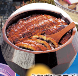
うなぎひつまぶし