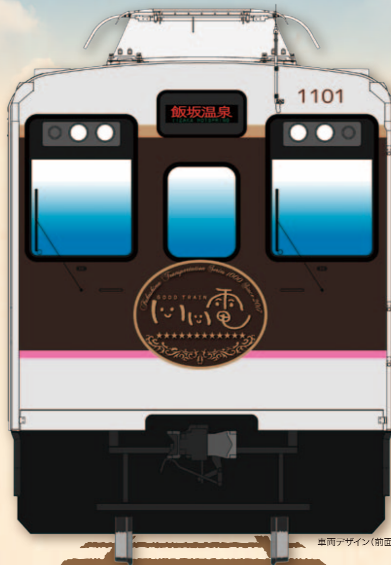
車両デザイン(前面)