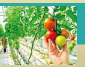
トマトのテーマパーク「ワンダーファーム」【いわき市】