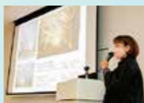
東日本大震災・原子力災害伝承館(語り部講話)

宿泊施設⇒A班⇒【双葉町】東日本大震災・原子力災害伝承館(フィールドワーク、語り部講話等研修プログラム)⇒B班⇒①【南相馬市】福島ロボットテストフィールド ②【富岡町】環境省特定廃棄物立情報館「リプルンふくしま」 ③【楡葉町】JAEA楡葉遠隔技術開発センター ④【富岡町】東京電力廃炉資料館(①～④のいずれかを選択) ※A班・B班を午前と午後で入れ替えて分散見学⇒南相馬市、相馬市の宿泊施設(宿泊/18:00)