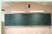
震災遺構浪江町立請戸小学校

宿泊施設⇒【浪江町】震災遺構浪江町立請戸小学校⇒【双葉町】東日本大震災・原子力災害伝承館⇒【大熊町】大川原地区(昼食)⇒【富岡町】東京電力廃炉資料館⇒【楡葉町】JAEA楡葉遠隔技術開発センター⇒JRいわき駅(18:00到着)