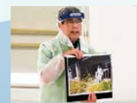
震災の教訓を伝える「語り部」の講話