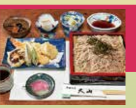
蕎麦酒房 天山【川内村】