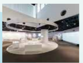
福島県環境創造センター「コミュタン福島」【三春町】