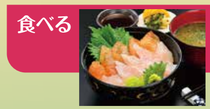
復興市民市場「浜の駅松川浦」【相馬市】