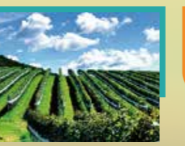
かわうちワイナリー【川内村】