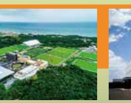
Jヴィレッジ【櫛葉町・広野町】