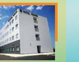
ホテルグラーデ新地【新地町】