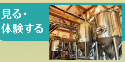
クラフトビール醸造所「ホップガーデンブルワリー」【田村市】