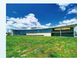
東日本大震災・原子力災害伝承館【双葉町】