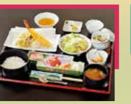
展望の宿 天神【櫛葉町】